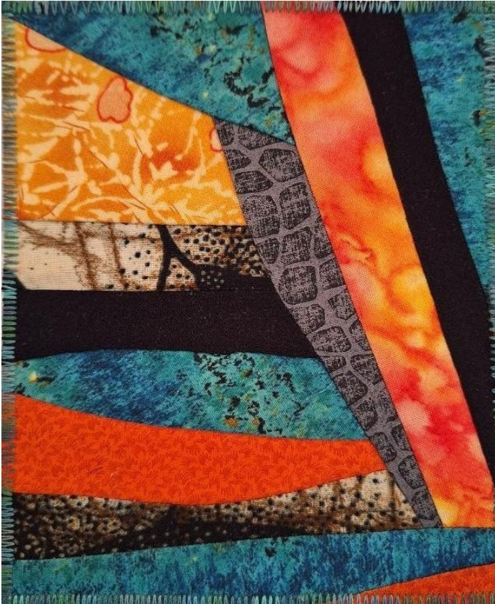
Travail en tissus d'Hélène Delvaux-Ledent.